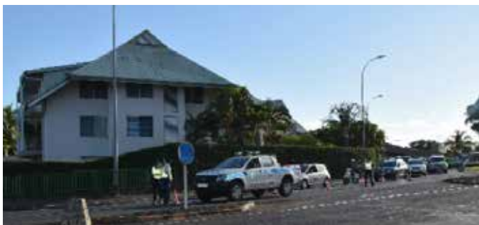
Contrôle des attestations de déplacement dérogatoire par la Police municipale et la gendarmerie - Rond-Point Erima - Arue vers Papeete -

Nous avons réussi à stopper la propagation de ce virus grâce à vous. Vous avez accepté le confinement et aussi respecté les règles qui n'étaient pas toujours facile vu la chaleur qui persistait dans la journée. Ensemble nous avons réussi et la police municipale a été fière de vous servir pendant la durée de ce confinement.