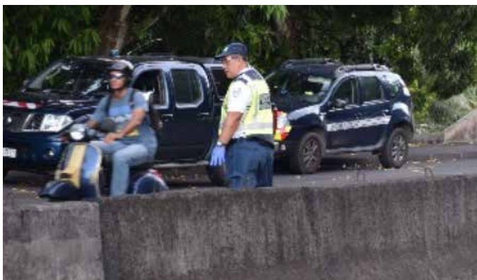
Contrôle des attestations de déplacement dérogatoire par la Police municipale et la gendarmerie - Descente du Tahara'a Arue -